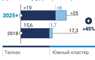
Добыча руды (млн т)